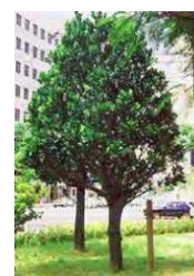
【市木】:フクギ/Fukugi 幸福や繁栄をもたらすとされる常緑高木。

※なお、コロナの感染状況によっては、オンラインで開催することもあります。この場合は、前もって決定し、参加者の皆様には事前に対策方法をご連絡いたします。